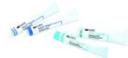
Paquete de Cemento RelyX™ Veneer: 56660 y 35014